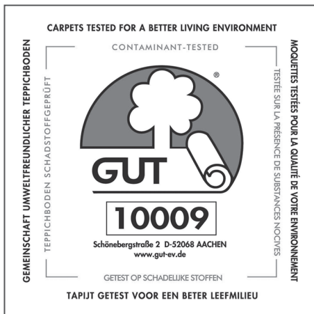
Abbildung 5: GuT-Siegel

Die „Gemeinschaft umweltfreundlicher Teppichboden e.V.“ (GuT) prüft Teppichböden und Teppiche auf gesundheitliche und ökologische Aspekte [9]. Halten die geprüften Bodenbeläge die GuT-Verwendungsverbote z. B. für schwermetallhaltige Farbstoffe ein und erfüllen sie die GuT-Kriterien im Rahmen der Schadstoffprüfung auf gesundheitsgefährdende Stoffe wie z. B. Formaldehyd, Benzol und flüchtige organische Verbindungen, so wird ihnen das GuT-Siegel (Abbildung 5) verliehen.