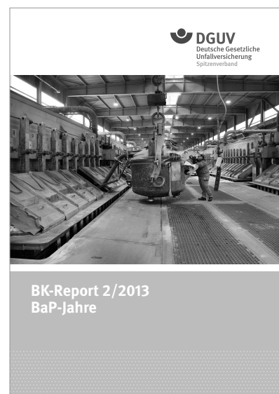
Titelseiten der BK-Reports „BaP-Jahre“ [7] und „Faserjahre“ [8].

entwickelte Tool Stoffenmanager® hat das IFA für den Einsatz an Arbeitsplätzen in Deutschland als GESTIS-Stoffmanager/Stoffenmanager® weiterentwickelt. Um die Abschätzungen zu optimieren und den Geltungsbereich des GESTIS-Stoffmanagers zu erweitern, werden kontinuierlich verschiedene Forschungsprojekte zur Kalibrierung und Validierung durchgeführt. Hierfür werden auch Daten aus MEGA hinzugezogen. Sie spiegeln Expositionssituationen in der betrieblichen Praxis wider und dienen als Goldstandard für Kalibrierungen und Validierungen.