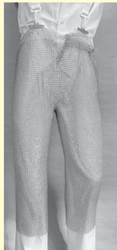
Abbildung 2: Stechschutzhose