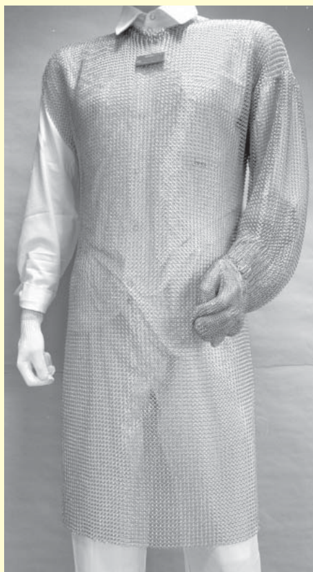
Abbildung 1: Bolero mit Arm

Eine quasimathematische und dabei aber sehr einfache und leicht nachvollziehbare Methode der stich- und schnittspezifischen Gefährdungsbeurteilung stellt die Verwendung der RPZ dar. Dies ist ein aus der DIN EN ISO 1050 (Leitsätze zur Risiko-beurteilung) abgeleitetes Verfahren, bei dem das Produkt aus Verletzungsschwere (V) und Auftretenswahrscheinlichkeit (A) gebildet wird ( RPZ = V \times A ). Hiermit werden anschaulich und nachvollziehbar die Situationen zum Zeitpunkt der Gefährdungsbeurteilung und die möglichen Effekte durch Änderung des Arbeitsverfahrens und/oder des PSA-Einsatzes aufgezeigt (vgl. auch Beispielsammlung in BGI 864). Sowohl die Schwere der Verletzung (V) als auch die Wahrscheinlichkeit