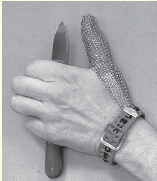
Abbildung 4: Daumen-Schnittschutz, zum Beispiel für Schälarbeiten

Auch in dieser BGR fand das breitere und innovative Angebot an speziellen Stich- und Schnittschutzlösungen seinen Niederschlag. Die Statistik weist aus, dass etwa 89 % der Stich- und Schnittverletzungen das Hand-Arm-System betreffen. Grund genug, dieser Problematik eine eigene BGR zu widmen. Auch hier gingen die Mitglieder des Sachgebietes davon aus, dass nur eine umfassende und anschauliche Information der Verantwortlichen, der Anwender und der Beschaffer ein Optimum an Wirkung erzielen kann. Da diese BGR zeitlich vor der BGR „Benutzung von Stechschutzbekleidung“ erschien, konnten die dort vorhandenen Erfahrungen mit der RPZ natürlich noch nicht eingeflossen sein. Hier wurden die Schwerpunkte auf eine deskriptive Erfassung der Einsatzbedingungen sowie auf die Gefährdungsfaktoren und die Ausschlussgründe gesetzt, bei denen keine der dort zuvor ausführlich in Wort und Bild beschriebenen PSA einzusetzen sind.