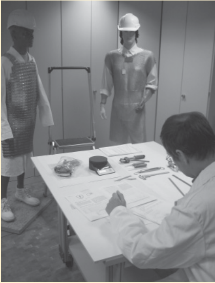
Abb. 2: Dokumentation der PSA-Prüfung.

lig zusammengebracht wurden – an einer berufsgenossenschaftlichen Information gearbeitet wird, die sowohl den Herstellern als auch den Anwendern von Handmessern einen klaren Überblick gibt, welche Eigenschaften Handmesser besitzen müssen, besitzen können oder die auf Grund von z. B. Normen gefordert werden. Zunehmend verlangen auch Kunden der Messerhersteller „Konformitätserklärungen“, was aber aus verschiedenen Gründen so nicht realisierbar ist.