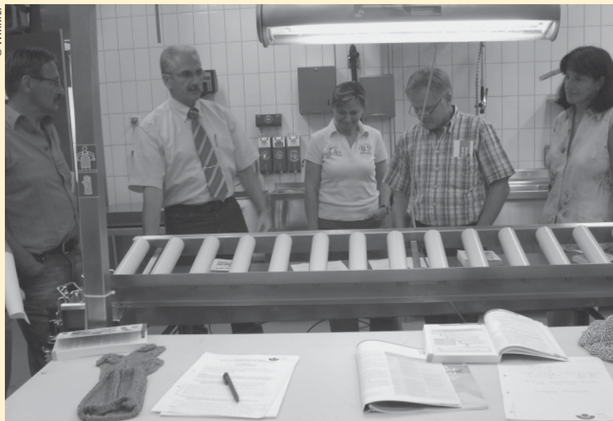
Abb. 3: PSA in der Weiterbildung von Berufsschullehrern.