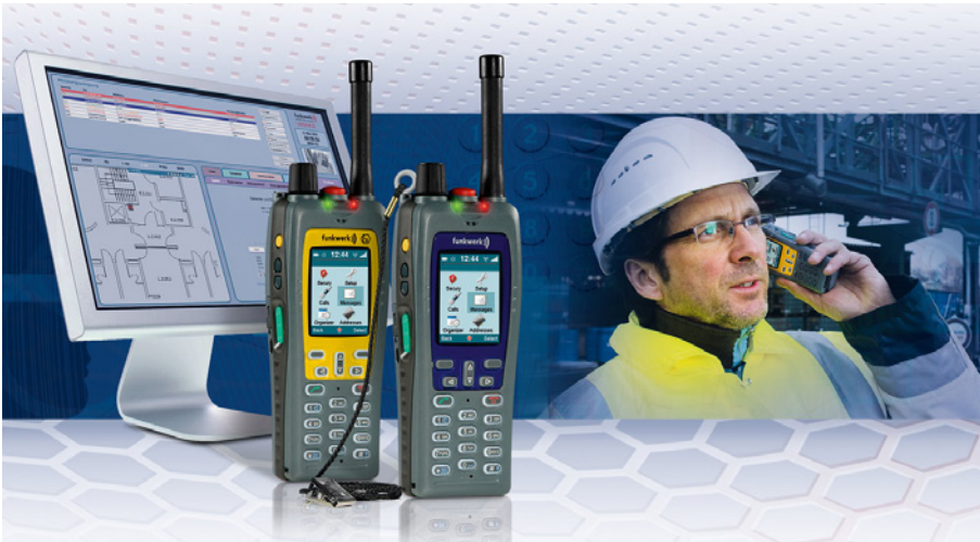
Abb. 1: PNG und Monitor der PNEZ (TSS)