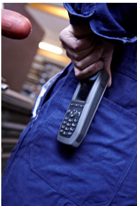
Abb. 3: Online-Datenbank, zertifizierte PNA

Internetseite des Sachgebietes PNA: www.dguv.de (webcode: d35669)