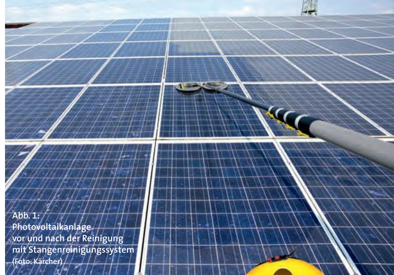
Abb. 1: Photovoltaikanlage vor und nach der Reinigung mit Stangenreinigungssystem

Da die Baustellenverordnung durch ihre Anwendungsbegrenzungen bei nachträglichen Installationen in vielen Fällen nicht gilt, werden Sicherheitsmaßnahmen von Bauherren, aufgrund fehlender gesetzlicher Vorgaben und/oder aus Kostengründen, oft vernachlässigt. Diese Aussage beruht auf Erfahrungen des Autors im Bereich der Photovoltaikreinigung.