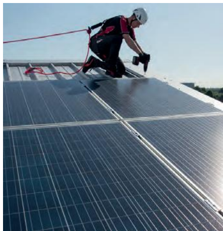
Abb. 4: Mobile Laufwege durch PSAgA

Für Steildächer gibt es Dachhaken aus Edelstahl, die auf den bestehenden Sparren befestigt werden (Abb. 6). Hierbei sollten möglichst immer Haken verwendet werden, die in alle Richtungen belastbar sind. Nur so ist das Reinigungs-