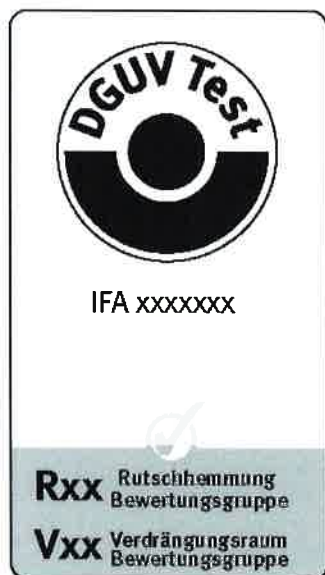
Abbildung 1: BGR/GUV-R 181

Erreicht der Bodenbelag eine positive Bewertung, so wird ein Prüfzeugnis ausgestellt. Falls gewünscht und im Auftrag angegeben, kann zusammen mit dem positiven Prüfzeugnis die DGUV Test Prüfbescheinigung erteilt werden, die zur Führung des DGUV Test-Zeichens berechtigt (Abbildung 1 und 2); ist dies der Fall, so ist die Form der Kennzeichnung mit dem IFA abzustimmen und ein Kennzeichnungsmuster zur Genehmigung vorzulegen.