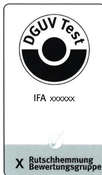
Abbildung 2: BGI/GUV-I 8527

Prüfzeugnisse mit positiver Beurteilung des Prüfobjekts werden in der Gültigkeitsdauer auf 5 Jahre begrenzt.